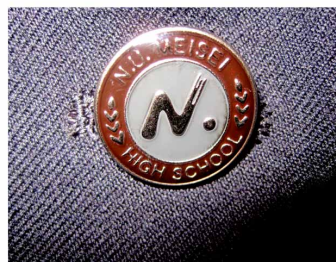
ブレザーのボタン

ブレザーのボタンは 「N. (エヌ ドット)」のデザイン を採用 (日大の付属高校初)