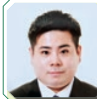
しん みく と 新 未来渡 1－8