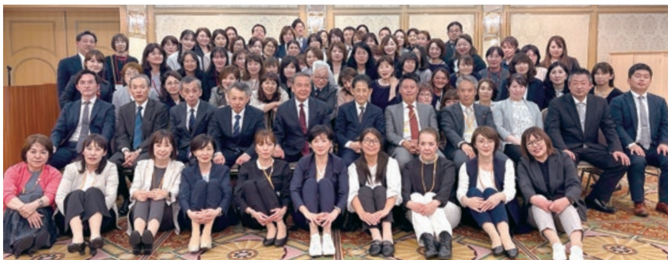
新旧役員歓送迎会

研修部会の活動は役員・委員を対象とした日本大学学部訪問研修会と後援会主催講演会があります。中でも主要な行事の1つが日本大学の学部訪問です。企画から運営、実施まで行います。昨年度は生物資源科学部を訪問しましたが、今年度は芸術学部を訪問しました。実際の大学施設を見学し、講義や研究内容に触れることで大学生活への具体的なイメージを持つことができます。また大学の先生方から直接話を伺うことで進学後の学びやキャリアについての理解を深める貴重な機会になります。講演会では子どもの成長に関わるテーマなど専門家による講演を開催します。保護者の皆様が楽しく、前向きに学べる場を提供できるよう運営していきますので、役員・委員の皆様のご参加、ご協力をお願いいたします。